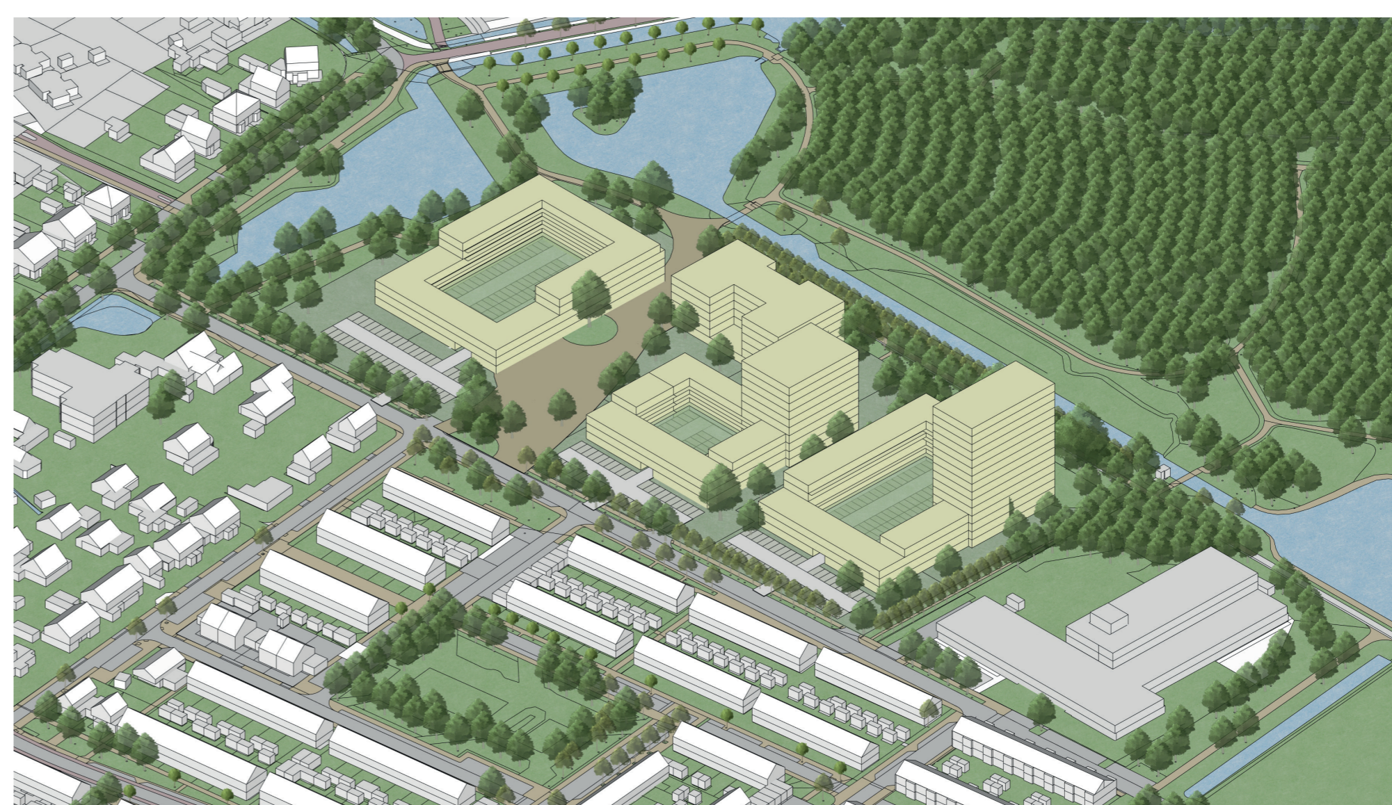
Nieuwe situatie plangebied