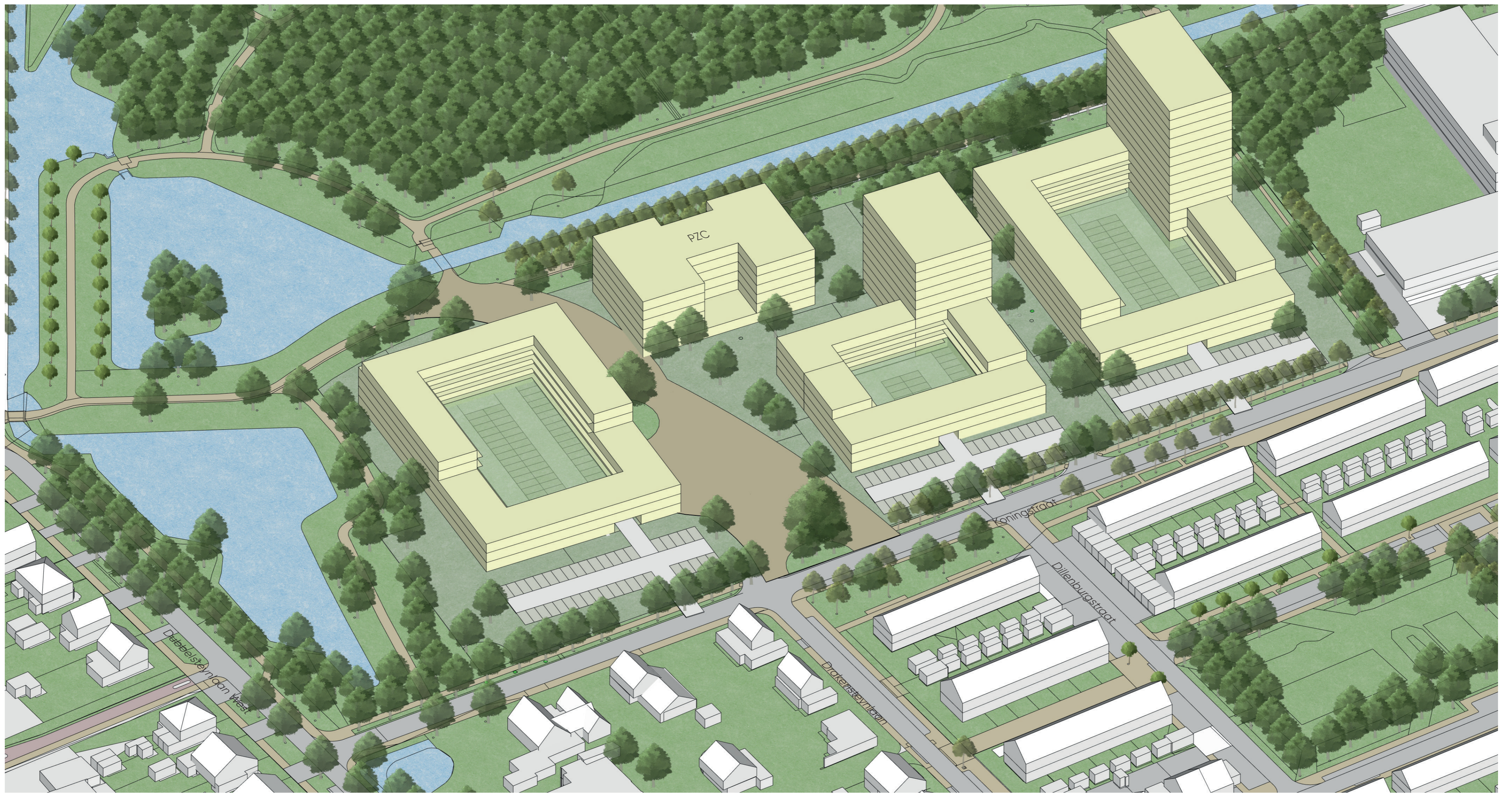
De nieuwe gebouvvolumes op het terrein van PZC gezien vanaf de Koningstraat