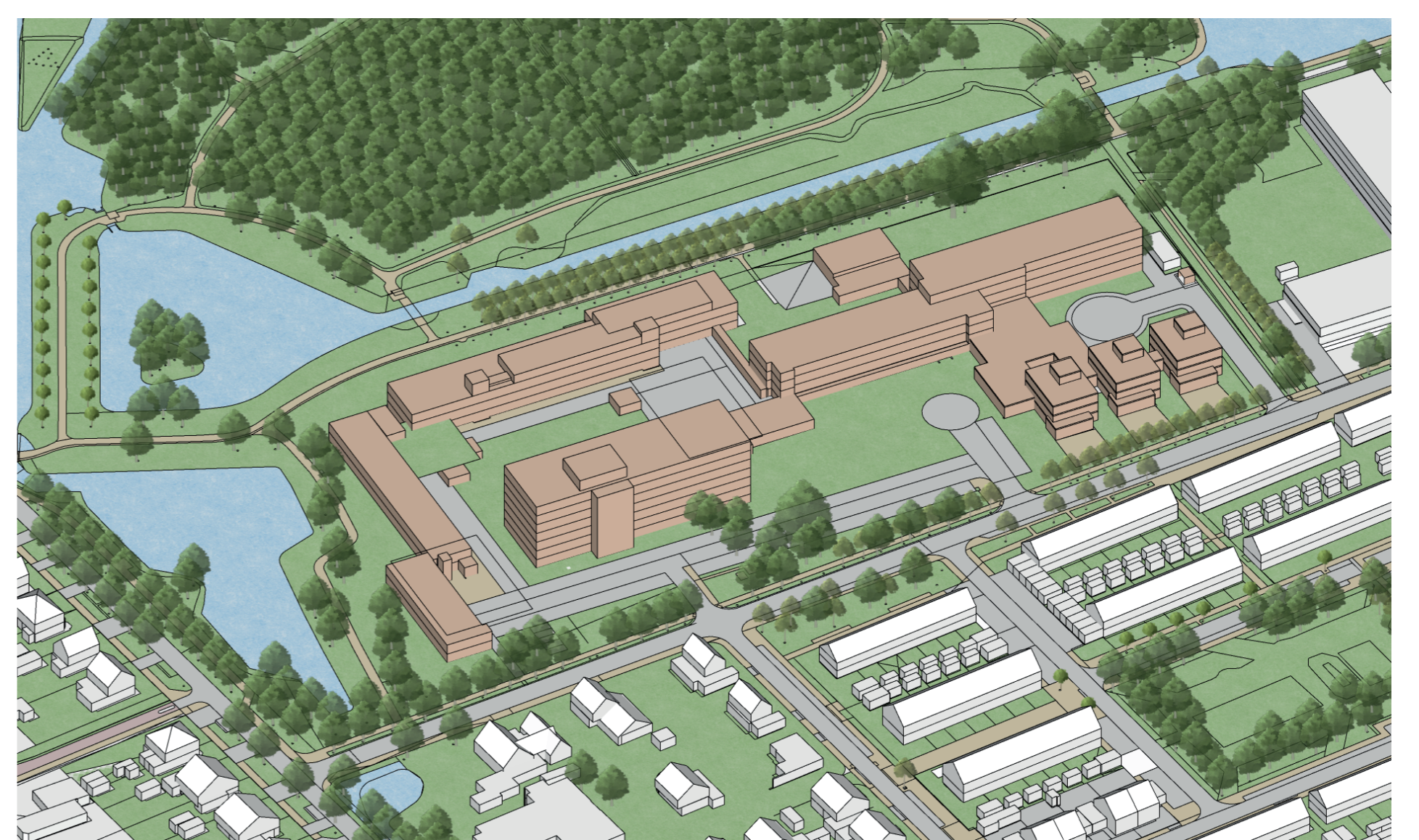
PZC bestaande bebouwing