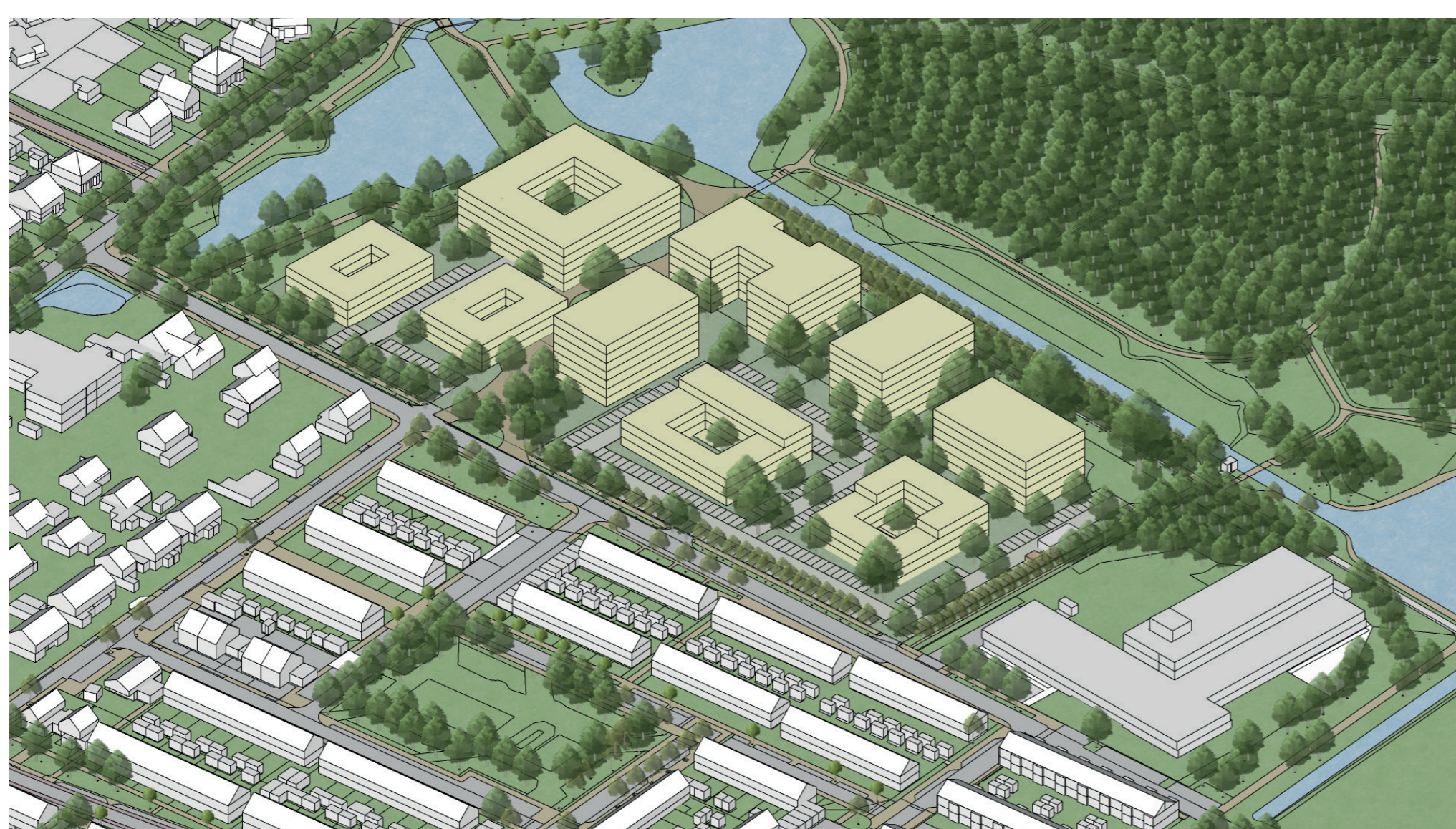
Situatie plangebied vorige bewonersavond

Uw input is van groot belang om deze visie verder vorm te geven. Samen maken we van Dubbelmonde een plek waar iedereen zich thuis voelt.